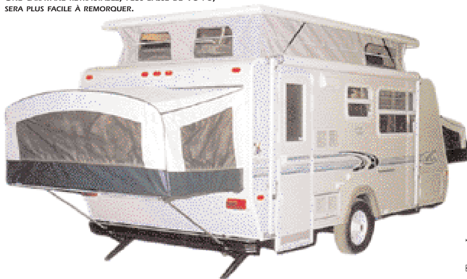
UNE CARAVANE RÉTRACTABLE, PLUS BASSE DE 18 PO, SERA PLUS FACILE À REMORQUER.