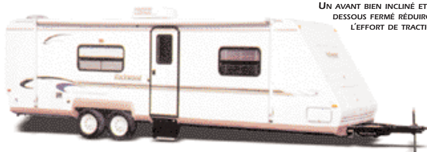
UN AVANT BIEN INCLINÉ ET UN DESSOUS FERMÉ RÉDUIRONT L'EFFORT DE TRACTION.

en une perte de contrôle et une sortie de route. L'ajout de freins électriques à une tente-caravane qui n'en est pas pourvue est un excellent investissement pour protéger votre famille et votre équipement. La majorité des